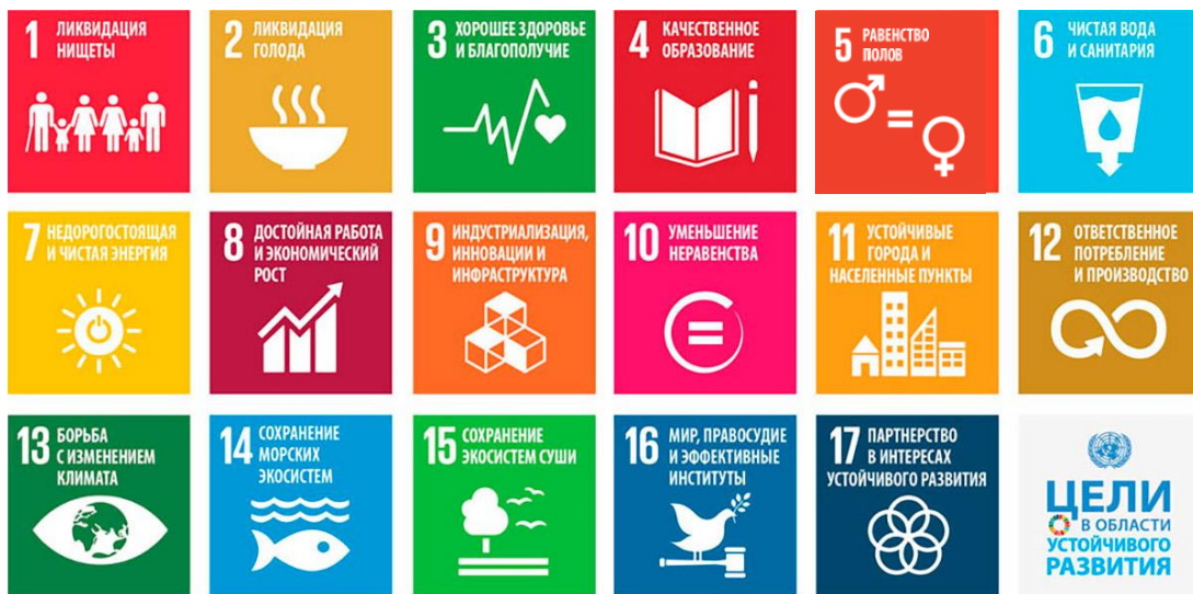
Рисунок 1 Цели устойчивого развития ООН

Подход Компании к деятельности в области устойчивого развития ориентирован на выполнение стратегических задач, которые сформулированы на основе Целей устойчивого развития ООН (далее — ЦУР ООН) и Национальных целей развития Российской Федерации на период до 2030 года.